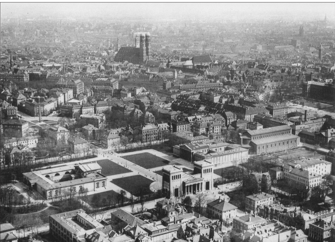
Der begrünte Königsplatz vor den massiven Eingriffen der Nationalsozialisten, um 1930.

der gegenüber liegenden Seite ein von Georg Friedrich Ziebland im korinthischen Stil entworfenes Kunst- und Industrieausstellungsgebäude hinzu, in dem heute die Staatliche Antikensammlung untergebracht ist. Erst 1862 wurde der Platz mit der Errichtung der »dorischen« Propyläen durch Klenze vollendet.