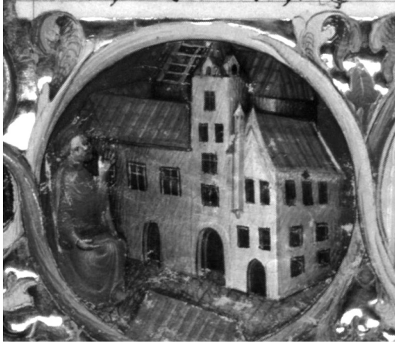
Abb. 1: Herzog Albrecht III. von Österreich als Stifter des Collegium Ducale in Wien (Initiale), in: Guillaume Durand de Mende, Rationale divinatorum officiorum (1384), Österreichische Nationalbibliothek Wien, Cod. 2765, fol. 1 r ( http://data.onb.ac.at/rec/baa4970570 ).

dem Krakauer Collegium Maius gruppiert sich das Gebäude um einen Innenhof im Rechteck. Diese Anordnung folgt einem besonders weit verbreiteten Motiv der Kollegienarchitektur. Neben Professorenwohnungen enthielt das Quadrum die stuba communis , eine Halle für akademische Akte aller Art (etwa für Promotionsfeiern), außerdem Räume für die Bibliothek ( libraria ) und Vorlesungen ( lectoria ). 15