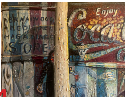
Gemälde von Bruno Reichart