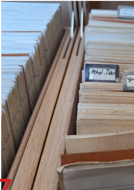
Blick in den Zettelkasten, Foto: Friedrich Ulf Röhrer-Ertl