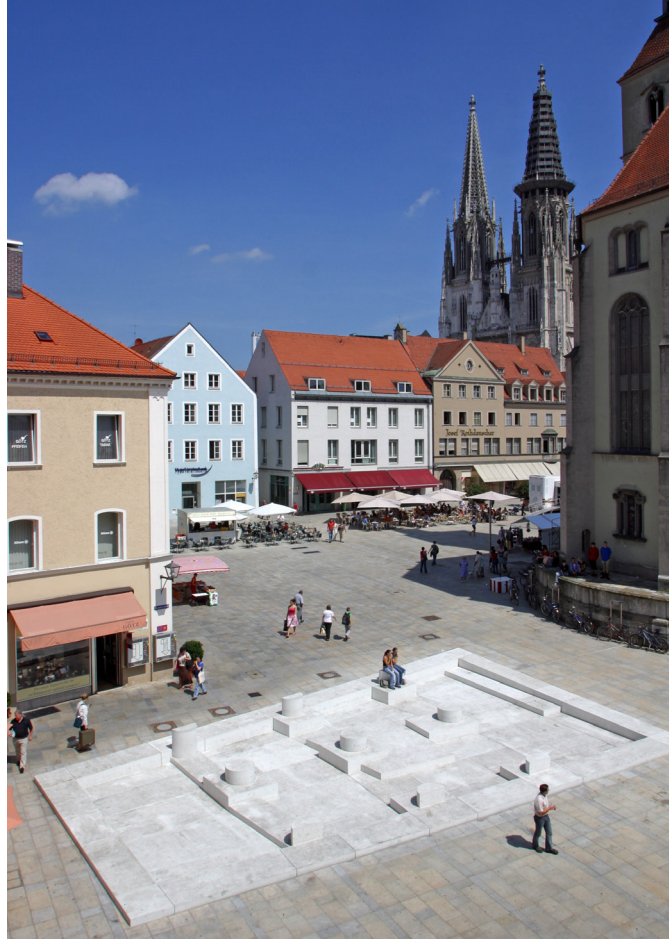
Das Bodenrelief »Misrach« auf dem Neupfarrplatz, 2005 von Dani Karavan entlang der Grundmauern der einstigen Synagoge errichtet

Mit der fortschreitenden Verbesserung der Quellenlage und der zunehmenden Literatur gewannen »weiche« Themen wie Wissenschaft und Bildung, Kunst und Kultur mehr biografische Aufmerksamkeit, die immer wieder abgelöst wurde durch die Auswirkungen von Kriegen und Katastrophen wie die Verheerungen im Dreißigjährigen Krieg und die napoleonische Zerstörung eines Teils der Altstadt. Apropos »Zerstörung der Altstadt«: Durch den wirtschaftlichen Niedergang im 16. Jahrhundert blieben die Viertel mit gotischen Bürgerhäusern als Alleinstellungsmerkmal Regensburgs weitgehend erhalten bis auf