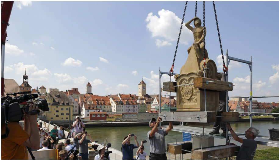
Das Bruckmandl kehrt 2018 auf seinen angestammten Platz zurück, Fotos: Stadt Regensburg, Bilddokumentation